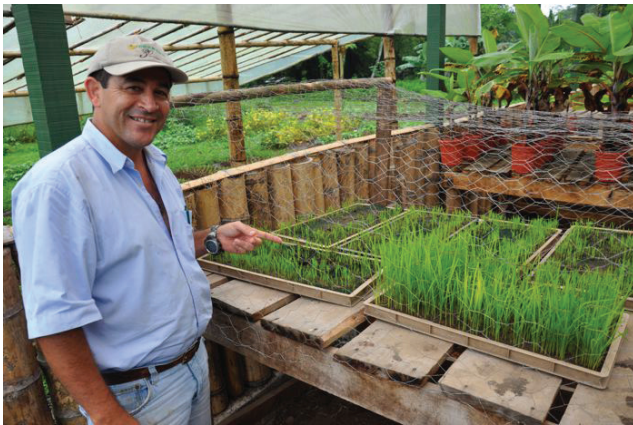
Imágen #1. Semillero en Costa Rica.

En este contexto, un gran número de prácticas incluyen: i) la selección y el tratamiento de las semillas; ii) la elevación de los viveros, con una baja densidad de semillas; imágen #1 iii) el enriquecimiento de los suelos con materia orgánica y una adecuada nivelación;