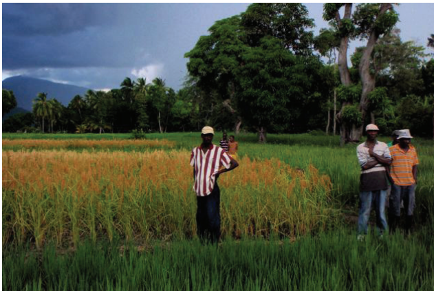
Imágen #3. Parcela en la que se empleó el SRI, Haití.

Se lleva a cabo una investigación exhaustiva, analizando paso a paso todo el ciclo del cultivo y examinando minuciosamente las diversas prácticas actuales.